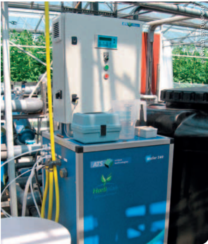
Elektrochemische activatie: een nieuwe ontsmettingstechnologie waarbij een zoutoplossing door een elektrolytische cel wordt gestuurd.

beeld van de werking en de praktische toepassing van ECA-water in allerlei teelten.