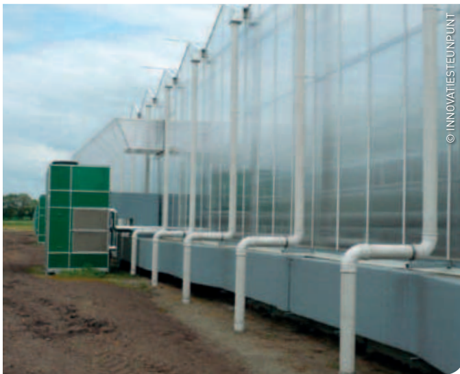
Warmte uit de serre recupereren en ontvochtigen met een klimaatunit.

Boorgat-energieopslag is een techniek voor opslag van warmte en koude in de bodem. In combinatie met een gasabsorptiewarmtepomp levert zo'n installatie bruikbare warmte aan een lagere temperatuur. De nieuwe bioserre in Kruishoutem wordt al een winter lang met zo'n systeem verwarmd.